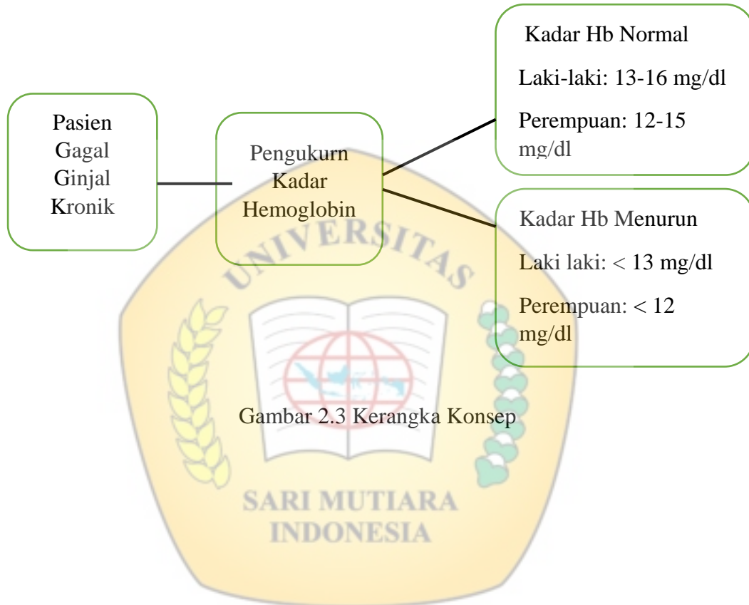
Gambar 2.3 Kerangka Konsep