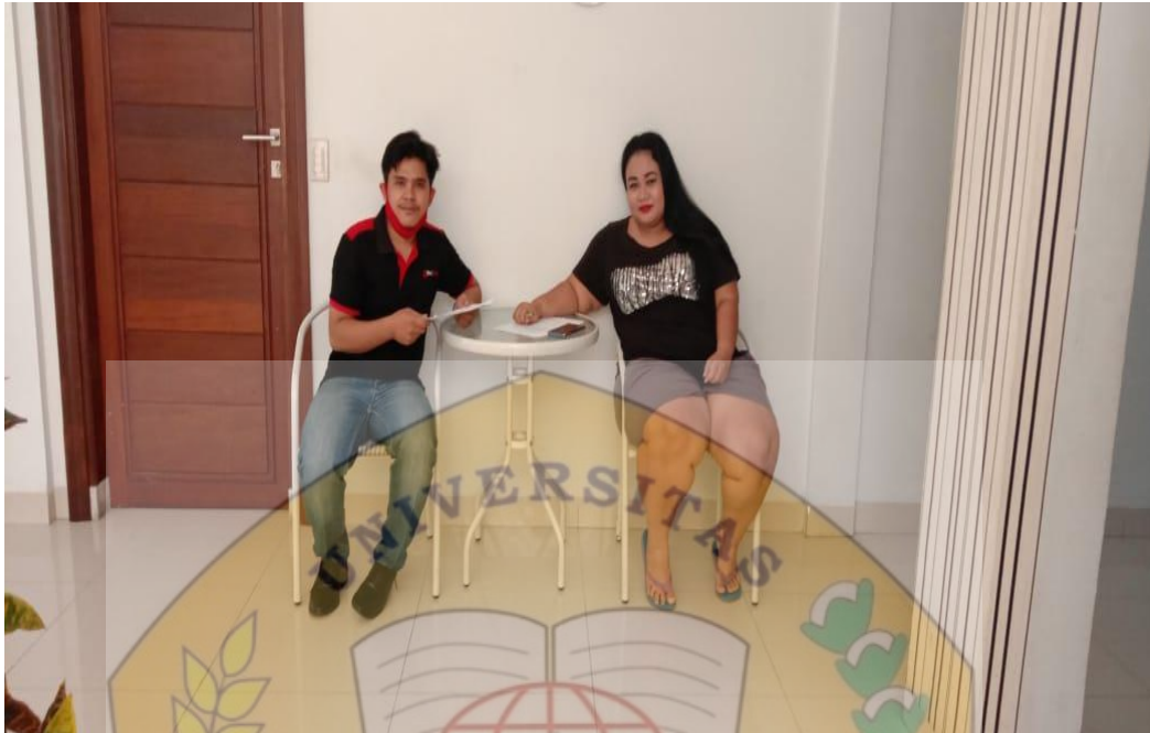
Foto Peneliti Saat Membagikan Kuesioner Penelitian Kepada Tamu yang Menginap Di Reddoorz Near Hermes Place Polonia Medan