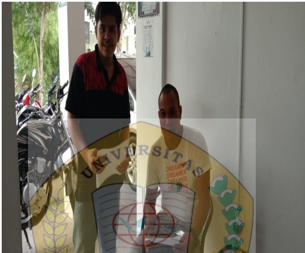
Foto Peneliti Saat Membagikan Kuesioner Penelitian Kepada Tamu yang Menginap Di Reddoorz Near Hermes Place Polonia Medan