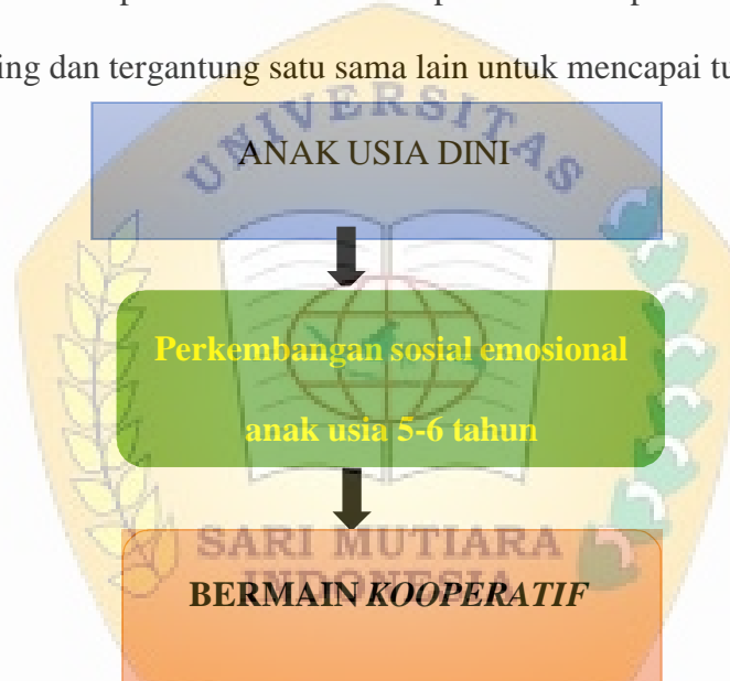
Gambar 2.1 Kerangka Berpikir

Bermain kooperatif adalah suatu kegiatan yang dilakukan anak yang melibatkan sekelompok anak dimana setiap anak mendapatkan peran dan tugasnya masing-masing dan tergantung satu sama lain untuk mencapai tujuan tertentu.