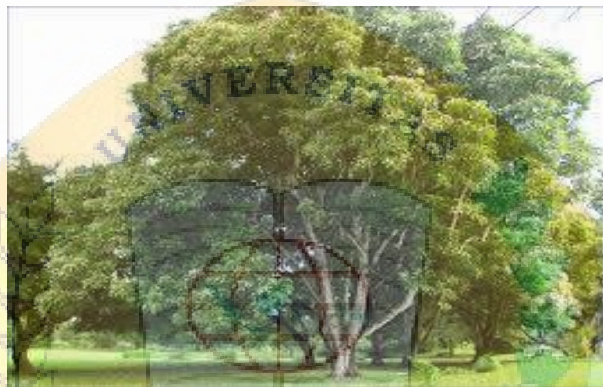
Gambar 2.5 Pohon Kemiri

Kemiri ( Aleurites moluccana ) merupakan tumbuhan yang hampir seluruh bagiannya dapat dimanfaatkan dengan produk utama biji kemiri sebagai sumber minyak dan rempah-rempah. Pohon kemiri ( Aleurites mollucana ) merupakan jenis yang mudah ditanam, cepat tumbuh dan tidak begitu banyak menuntut persyaratan tempat tumbuh. Tidak diketahui dengan tepat asal-usulnya, tumbuhan ini menyebar luas mulai dari India dan Cina, melewati Asia Tenggara dan Nusantara, hingga Polinesia dan Selandia Baru.