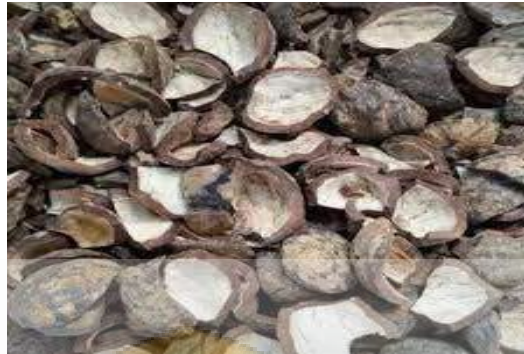
Gambar 2.6 Cangkang Kemiri

selulosa, dan lignin yang tinggi. Kandungan inilah yang dapat digunakan sebagai bahan bakar (Laos et al., 2016;Salindeho et al., 2017, p. 53).