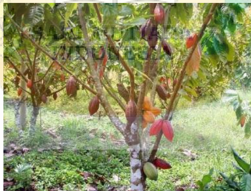
Gambar 2.3 Pohon buah kakao

negara, dan 5,59% perkebunan besar swasta dengan sentra produksi utama adalah Sulawesi Tengah, Sulawesi Selatan, Sulawesi Tenggara, Sulawesi Barat, Lampung dan Sumatera Utara. Buah kakao ( Theobroma cacao L. ) terdiri atas kulit buah, pulp, keping biji dan plasenta. Kulit buah ( pod ) kakao adalah bagian mesokarp atau bagian dinding buah kakao, yang mencakup kulit terluar sampai daging buah sebelum kumpulan biji. Kulit buah kakao merupakan bagian terbesar dari buah kakao. Buah kakao terdiri dari \pm 74% kulit buah, 2% plasenta dan 24% biji. Dengan semakin meningkatnya produksi biji kakao, jumlah kulit buah kakao juga semakin meningkat dan belum dimanfaatkan secara maksimal. Menurut data statistik perkebunan Indonesia, hasil perkebunan kakao Indonesia pada tahun 2015 sebesar 593.331 ton, terdiri dari perkebunan rakyat sebesar 562.346 ton, perkebunan negara sebesar 11.616 ton dan perkebunan swasta sebesar 19.369 ton (Statistik Perkebunan Indonesia Komoditas Kakao 2015 - 2017). Diperkirakan jumlah kulit buah kakao yang terbuang pada tahun 2015 sekitar 1.829.437 ton. Angka ini diperkirakan akan terus meningkat seiring dengan bertambahnya luas areal perkebunan baik perkebunan rakyat, perkebunan negara, maupun perkebunan swasta (Farikha 2010).