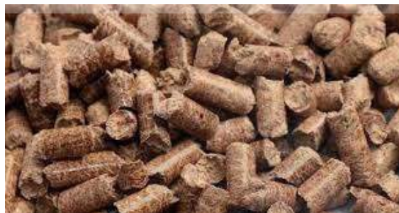
Gambar 2.1 Biopelet

Biopelet merupakan salah satu bentuk energi biomassa yang diproduksi pertama kali di Swedia pada tahun 80-an. Pelet diproduksi dengan menghancurkan bahan baku biomassa menggunakan hammer mill sehingga diperoleh massa partikel biomassa yang berukuran seragam. Massa partikel tersebut kemudian diumpankan ke dalam mesin pengepres dengan dies 6-8 mm dan panjang 10-12 mm. Tekanan yang sangat tinggi menyebabkan suhu massa kayu meningkat, sehingga senyawa lignin pada kayu berubah sifat plastisitasnya membentuk perekat alami dan menghasilkan pelet-pelet kayu yang padat dan kompak pada saat dingin. Proses pembuatan biopelet terdiri atas beberapa tahap, yaitu: perlakuan pendahuluan (pre-treatment) bahan baku, pengeringan (drying), pengecilan ukuran (size reduction), pencetakan biopelet (pelleting), pendinginan (cooling), dan silage. Model fisik biopelet yang telah dikenal disajikan pada Gambar 2.1