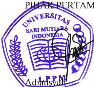
Adiansyah Ketua LPPM USM-Indonesia