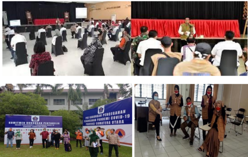
Gambar 1. Penyampaian Komitmen Kepada Peserta

Komitmen hakikatnya adalah ikhtiar untuk membangun dan memastikan hubungan kerjasama yang produktif serta kemitraan yang harmonis. Pentahelix sebagai persinggungan kesadaran bersama pemerintah dan masyarakat memungkinkan terlaksananya tekad ini, melindungi warga yang masih sehat agar tidak tertular penyakit dan semaksimal mungkin menyembuhkan yang telah sakit. Pendekatan berbasis komunitas ini penting untuk menggempur corona dari berbagai sisi. Sekaligus memberikan kejelasan rantai koordinasi dan kendali dalam gugus tugas percepatan penanganan Covid-19.