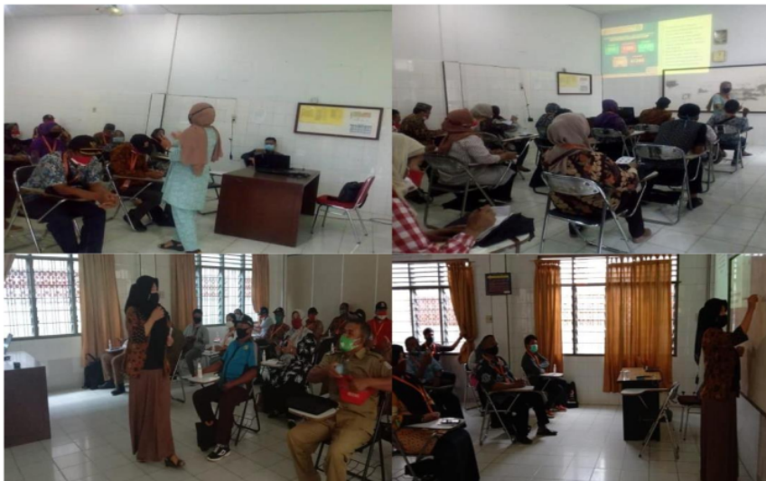
Gambar 2 Kegiatan Pelatihan

Pelatihan ini bertujuan untuk memperkuat Satgas Covid-19 dalam menegakkan protocol kesehatan melalui edukasi, sosialisasi dan mitigasi. Diharapkan setelah dilakukan pelatihan, peserta (calon relawan) dapat menjadi agen perubahan di lingkungan keluarga, masyarakat dan tempat-tempat publik.